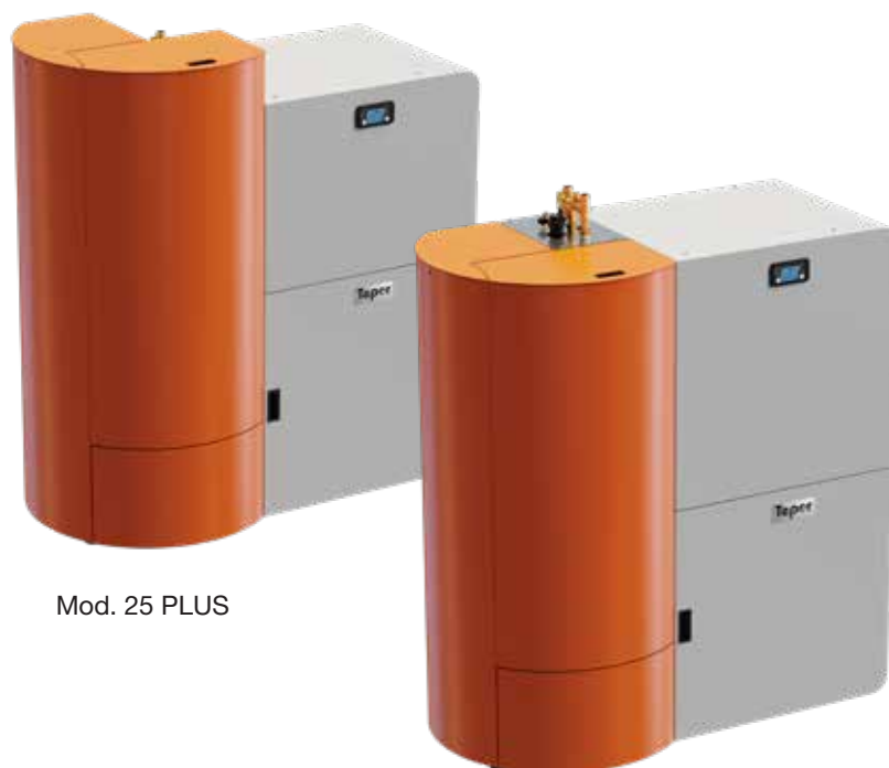
Mod. 25 PLUS

Valvola antisceppio / Explosion proof valve Soupape anti explosion / Explosionsschutzventil Válvula antiexplosión / Válvula anti-explosão